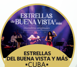
ESTRELLAS DE BUENA VISTA Y MÁS •CUBA •