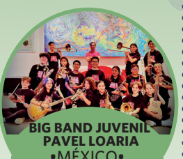
BIG BAND JUVENIL PAVEL LOARIA •MÉXICO •