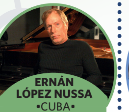
ERNÁN LÓPEZ NUSSA •CUBA •