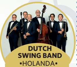
DUTCH SWING BAND •HOLANDA •