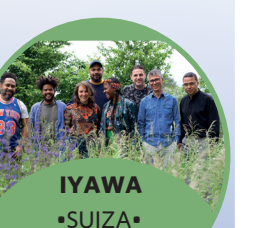
IYAWA •SUIZA •