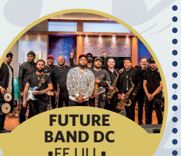
FUTURE BAND DC •EE.UU. •