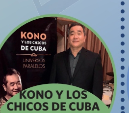
KONO Y LOS CHICOS DE CUBA •CUBA •