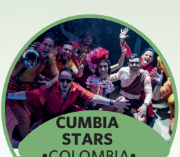
CUMBIA STARS •COLOMBIA •