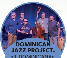
DOMINICAN JAZZ PROJECT •R. DOMINICANA •