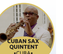
CUBAN SAX QUINTET •CUBA •