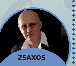
ZSAXOS •CUBA •