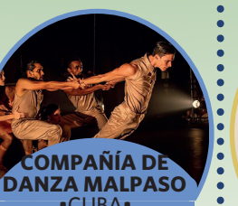
COMPAÑÍA DE DANZA MALPASO •CUBA •