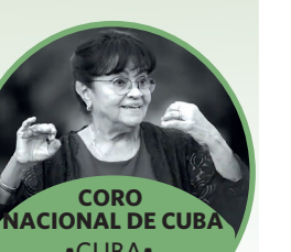
CORO NACIONAL DE CUBA •CUBA •