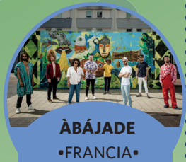
ÀBÁJADE •FRANCIA •