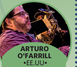
ARTURO O'FARRILL •EE.UU. •