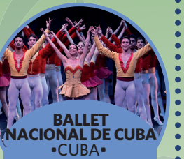
BALLET NACIONAL DE CUBA •CUBA •