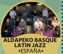
ALDAPEKO BASQUE LATIN JAZZ •ESPAÑA •