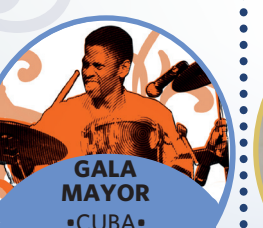
GALA MAYOR •CUBA •