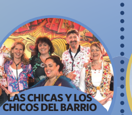
LAS CHICAS Y LOS CHICOS DEL BARRIO •HOLANDA •