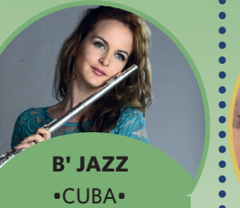
B' JAZZ •CUBA •